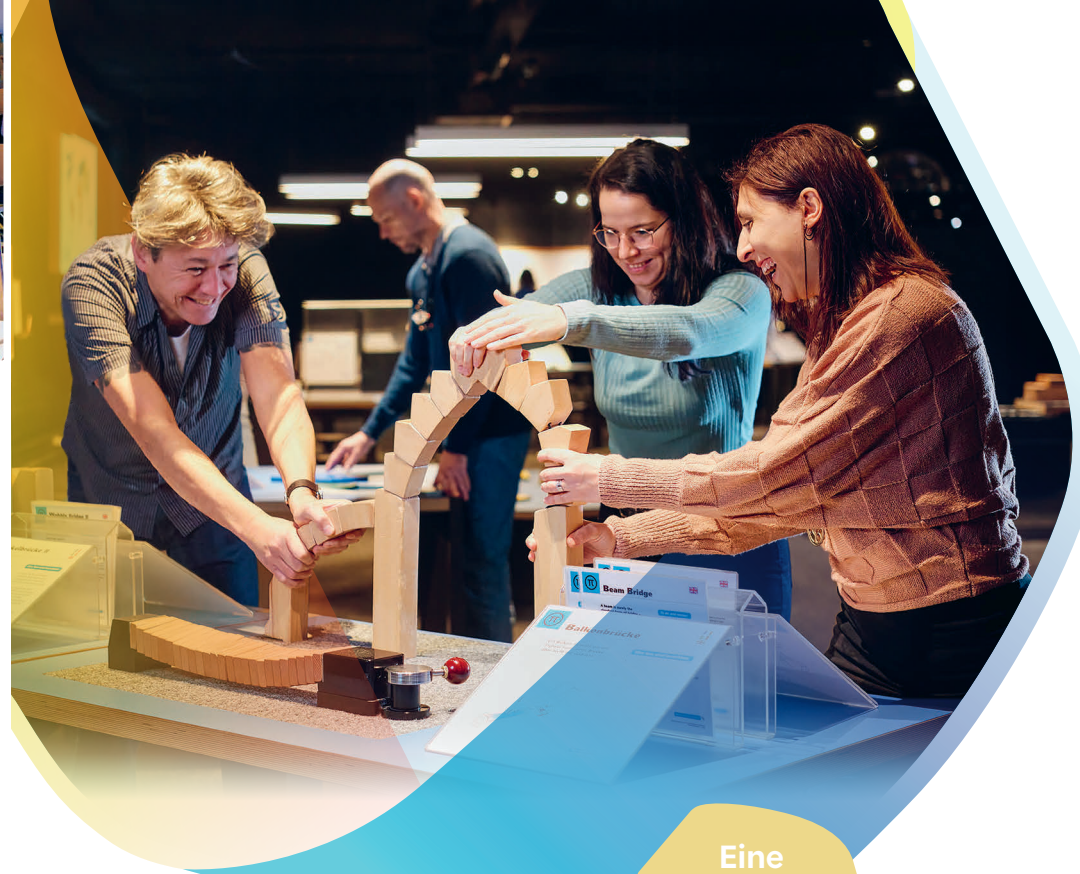
Eine Location, die Wissen schafft