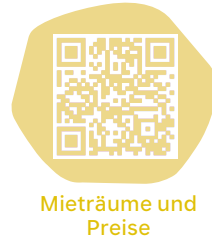
Mieträume und Preise

Das grosse Auditorium wie auch der Pavillon im Park sind zusätzlich mit einer Ton- und Lichtanlage ausgerüstet. Du hast bei der Miete die Wahl zwischen Tages- und Halbtagespauschalen. Selbstverständlich können die Räume auch ausserhalb der regulären Technorama-Öffnungszeiten belegt werden.