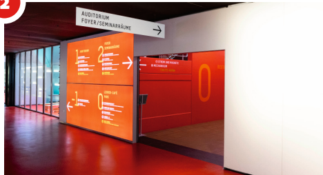
Erdgeschoss - Eingang zum Treppenhaus.