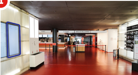
Erdgeschoss - Haupteingang.