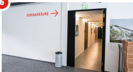
2. OG - Zugang Seminarräume